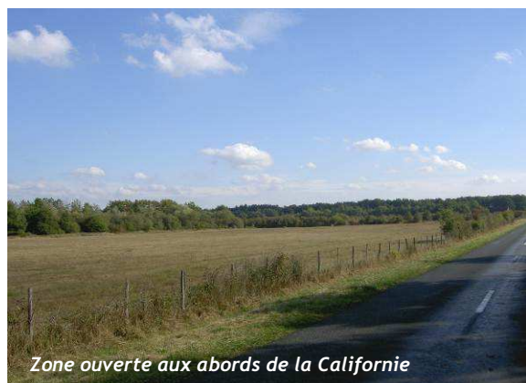
Zone ouverte aux abords de la Californie

Au Nord de la commune, un paysage semi-ouvert forme une petite enclave au cœur de la forêt de Sologne. Ce paysage se compose de prairies, de cultures céréalières de taille modeste et de friches (la nature du sol étant peu propice à l'agriculture). Le boisement est toujours présent en fond de perspective.