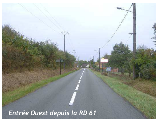
Entrée Ouest depuis la RD 61

Les autres entrées sont beaucoup plus intimistes : la végétation très présente masque le bourg et seule une des rives de la voie est urbanisée.