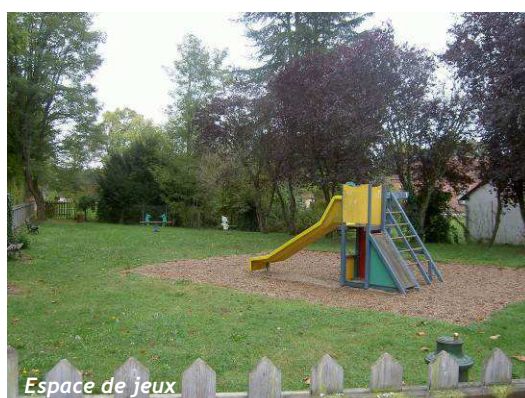
Espace de jeux

La vallée du Cosson marque la limite du centre ancien. Cet espace naturel communal est aménagé pour les habitants : pêche dans l'étang ou le Cosson, conservatoire des saules (40 espèces différentes) avec le lavoir et des espaces « pique-niques ».