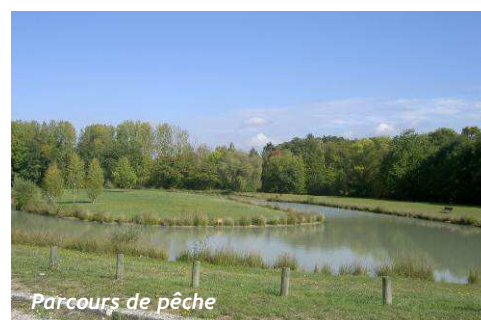
Parcours de pêche

La vallée du Cosson marque la limite du centre ancien. Cet espace naturel communal est aménagé pour les habitants : pêche dans l'étang ou le Cosson, conservatoire des saules (40 espèces différentes) avec le lavoir et des espaces « pique-niques ».