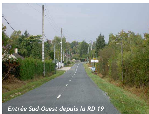
Entrée Sud-Ouest depuis la RD 19