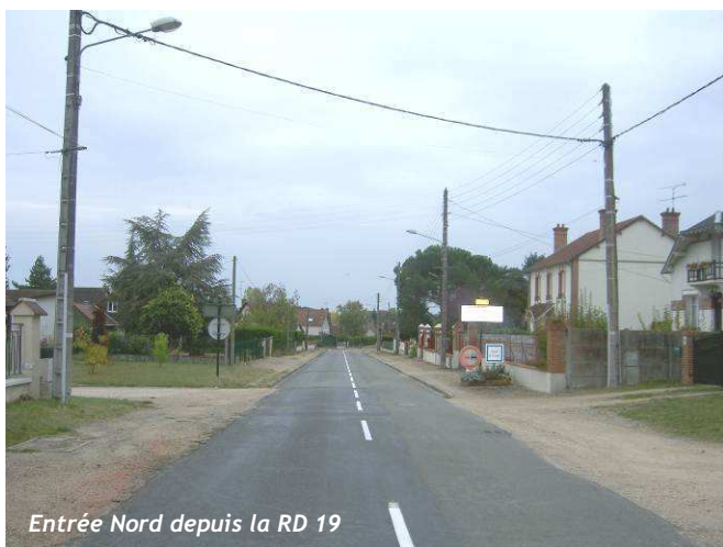
Entrée Nord depuis la RD 19

L'image du bourg varie selon les différentes entrées :