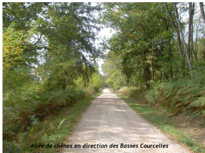
Allée de chênes en direction des Basses Courcelles

De nombreux chemins traversent la forêt et incitent à la randonnée (GR3c et 3 PR). Les clairières sont peu nombreuses. Certains chemins et allées forestières sont bordés par des alignements d'arbres intéressants de par leur port et leur envergure