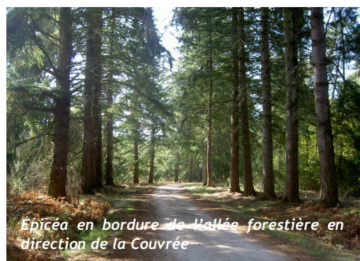
Épicéa en bordure de l'allée forestière en direction de la Couvrée