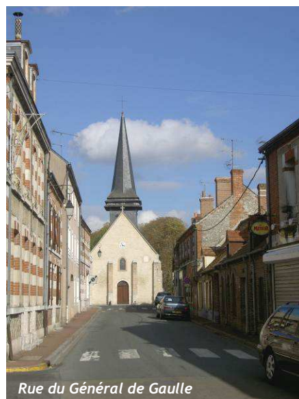
Rue du Général de Gaulle

Un peu plus en retrait, le centre ancien accueille également des espaces de loisirs avec la maison des expositions (bâtiment récent dont l'architecture moderne utilise des matériaux locaux), l'Écomusée, un espace de jeux pour les petits (derrière l'église).