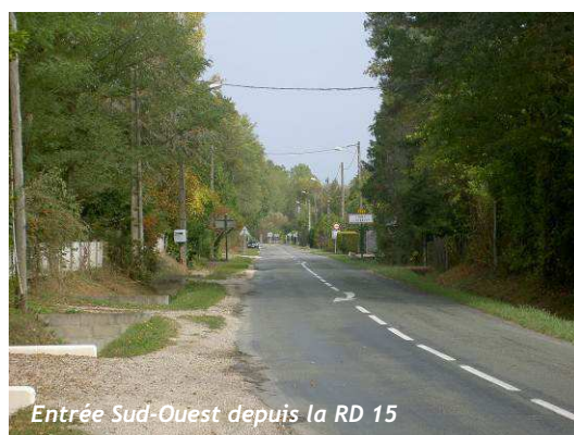
Entrée Sud-Ouest depuis la RD 15