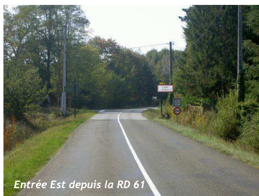
Entrée Est depuis la RD 61

L'entrée Nord-Est (RD 15) est plus traditionnelle et qualitative : les boisements bordant la voirie rectiligne s'interrompent seulement au niveau du panneau d'entrée de ville et l'église apparaît en fond de perspective.