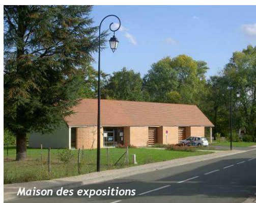
Maison des expositions

Un peu plus en retrait, le centre ancien accueille également des espaces de loisirs avec la maison des expositions (bâtiment récent dont l'architecture moderne utilise des matériaux locaux), l'Écomusée, un espace de jeux pour les petits (derrière l'église).