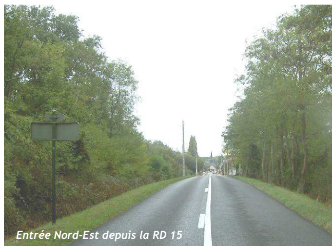
Entrée Nord-Est depuis la RD 15

L'entrée Nord (RD 19) offre l'image la plus urbaine du bourg, impression renforcée par la voirie rectiligne et l'urbanisation de rive présente en amont du panneau d'entrée de ville.