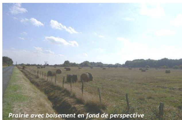
Prairie avec boisement en fond de perspective

Un terrain d'aviation a été aménagé dans ce secteur (terrain d'urgence pour l'aérodrome de Saint-Denis-de-l'Hôtel).