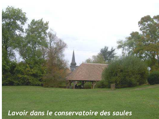
Lavoir dans le conservatoire des saules