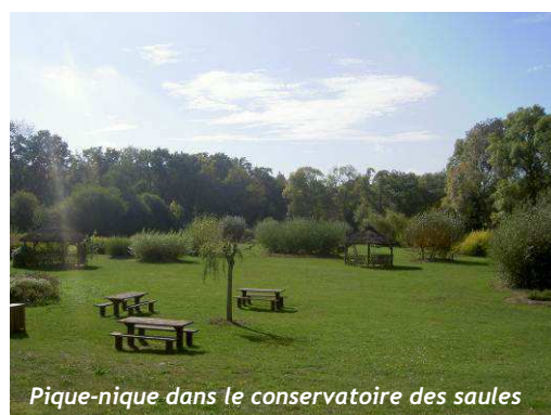
Pique-nique dans le conservatoire des saules