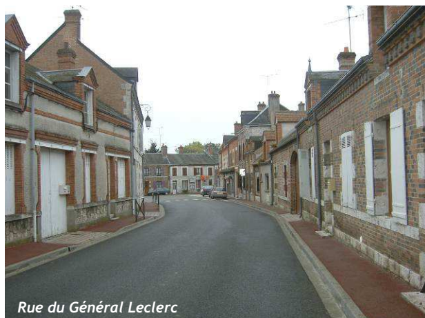
Rue du Général Leclerc

L'urbanisation dense forme un front de rue bâti continu.